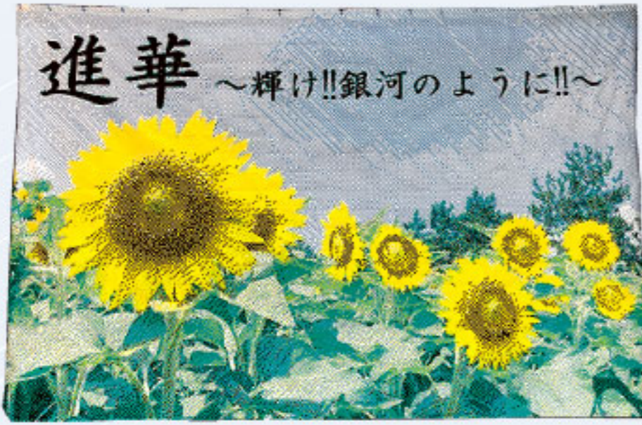
進華 ～輝け!!銀河のように!!～

打出中学校では9月の文化祭を生徒主体で企画運営をしています。本年度も合唱コンクールは非常にハイレベルな合唱を披露してくれました。文化祭当日の発表は、学年毎に予選を勝ち抜いたクラスのみでの発表でした。当日のできればはもちろん、予選からどのクラスもハーモニーがきれいで、表現力も抜群でした。また、本番に向かう姿勢も素晴らしいものがあります。生徒自身が互いに練習を呼び掛け、修正する部分を修正し