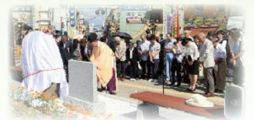
句碑 碑文「木曾の情 雪や生えぬく 春の草」

歴史があり松尾芭蕉が愛したわれわれの平野学区が今後ますます発展していくことを願っています。