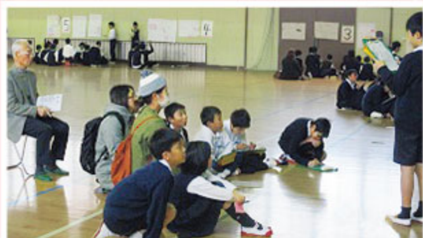
5年生・地域・保護者への発表の様子